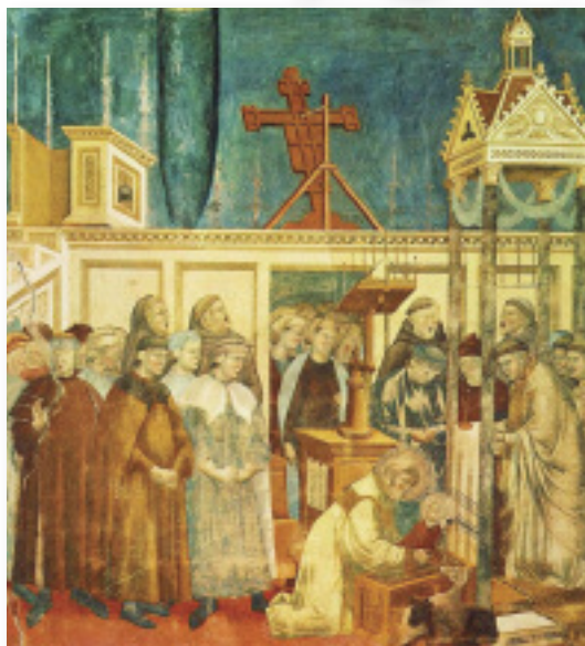
Nella foto: l'affresco di Giotto rappresentante la natività, nella Basilica superiore di Assisi.

Tradizionale nelle nostre case in questo periodo è la realizzazione del presepe. Con tale evento di gioia e di festa soprattutto per i più piccini si vuole ricordare la nascita di Gesù. Il presepe è per tradizione fatto risalire a San Francesco che, la notte di Natale del 1223, a Greccio (in provincia di Rieti), per la prima volta, organizzò una rappresentazione della natività. Durante la celebrazione della santa Messa, nella culla apprestata, comparve un bambino in carne ed ossa che il Santo prese tra le sue braccia. Tuttavia è da rilevare che le prime fonti del presepe sono i versetti dei Vangeli di Matteo e Luca.