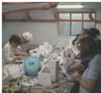
Nella foto: gli aderenti al Gruppo Presepi al lavoro per la realizzazione dei vari diorami.

Contemporaneamente alla mostra, si svolgerà, in collaborazione con la Parrocchia, il consueto concorso presepi suddiviso in due categorie: "I Ragazzi e il Presepio" riservato a ragazzi e giovani al di sotto dei 36 anni e "Gli Amanti del Presepio" per tutti coloro che, non più giovanissimi, sono tuttavia appassionati al presepe e alla sua tradizione.