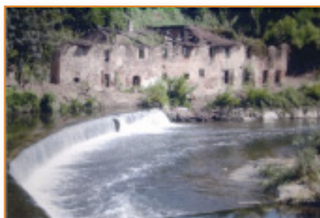
Nella foto: di G. Cerana il mulino Balbi nel 2009