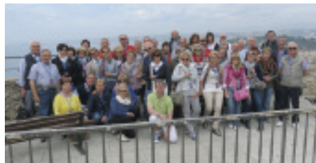
Nella foto: il gruppo

Sono programmate dal 23 agosto al 3 settembre e dal 20 settembre al 4 ottobre, due soggiorni marini. Il primo a San Bartolomeo a Mare (Liguria), il secondo nell'incantevole isola di Rodi (Grecia).