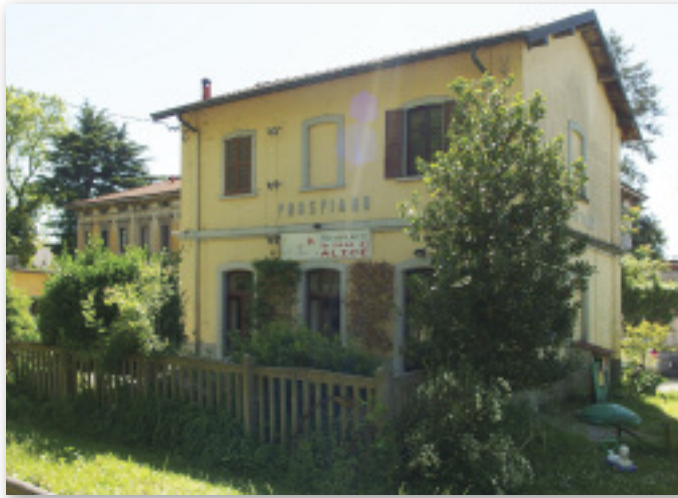
Casa di Alice

riali, Servizio Assistenza Domiciliari tutti gestiti dall'Azienda Speciale Consortile Mediolona (la cui sede è stata recentemente trasferita a Marnate in via Italia, in locali di proprietà comunale). Il lavoro è complesso: basti un dato ad esempio, gli