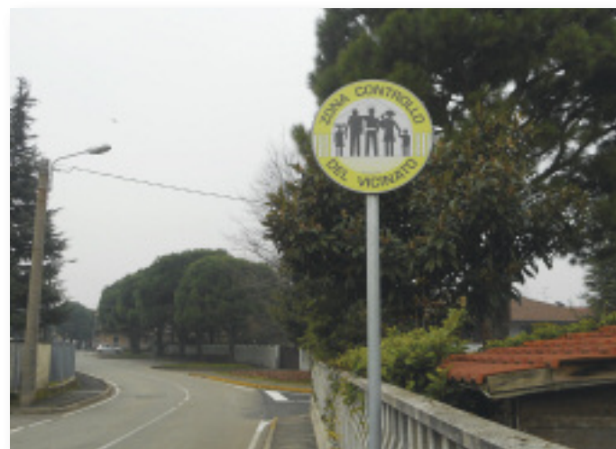
Controllo del vicinato