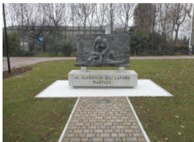
Monumento ai caduti sul lavoro

● Palestre e campi di calcio: rifacimento impianti di illuminazione; sostituzione copertura della palestra Gabelli (con notevole risparmio energetico); rifacimento campo di calcio Nizzolina e nuovi spogliatoi; nuove dotazioni tecniche alle palestre tra cui canestri ad altezza variabile e nuovi tabelloni di segnalazione.