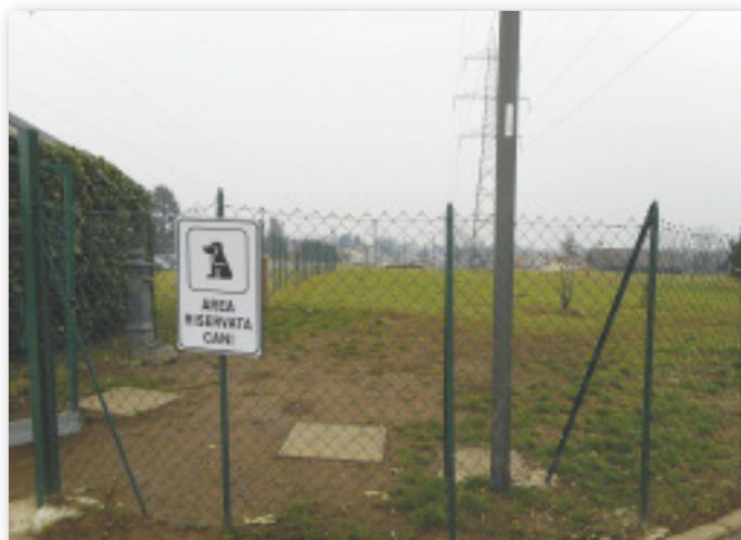
Area cani Nizzolina

● Orti urbani la creazione di questa forma di ... ritorno alla terra è stata avviata in fase sperimentale a Nizzolina con un buon numero di richieste ed utilizzo.