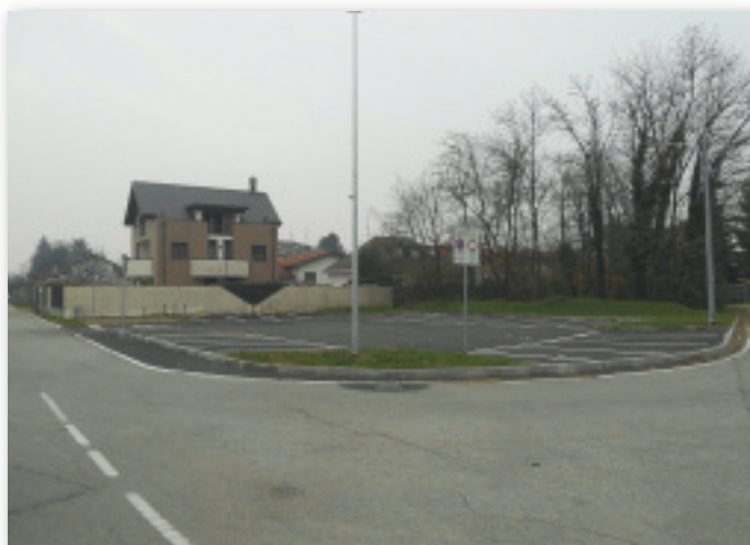
Parcheggio via Don Scazzosi