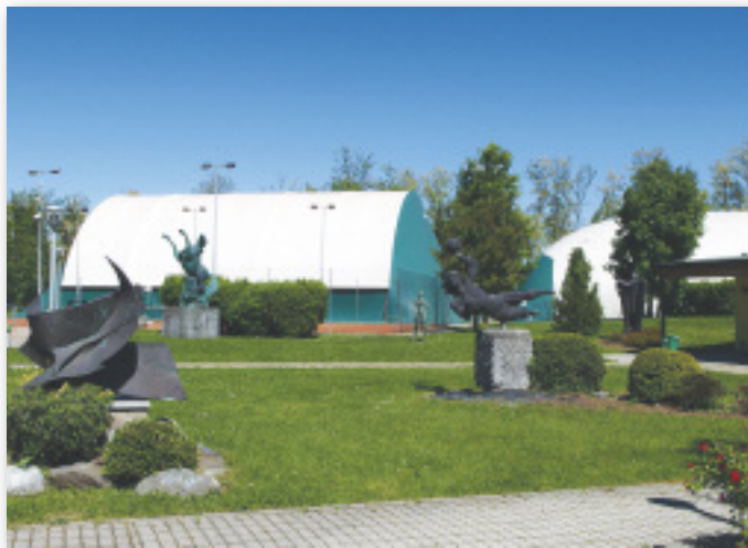
Area sportiva di via San Carlo

Particolare attenzione è stata riservata ai giovani cui sono state destinate risorse importanti. Il progetto "Marnate Giovani" volto ad individuare